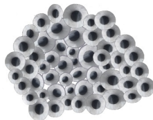
LAICH der Laich die Laiche