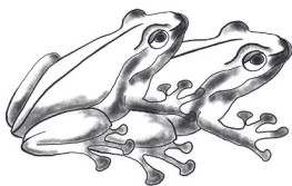
PAARUNG die Paarung die Paarungen