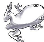
JUNGFROSCH der Jungfrosch die Jungfrösche