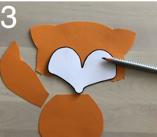
3 Zeichne mit der vierten Schablone die Augenpartie vor.