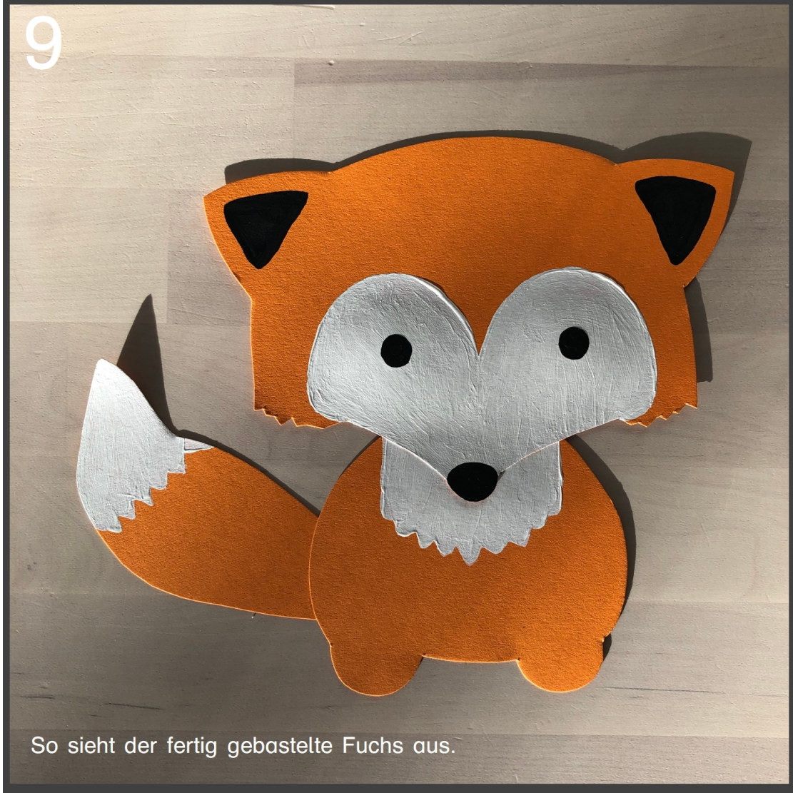
9 So sieht der fertig gebastelte Fuchs aus.