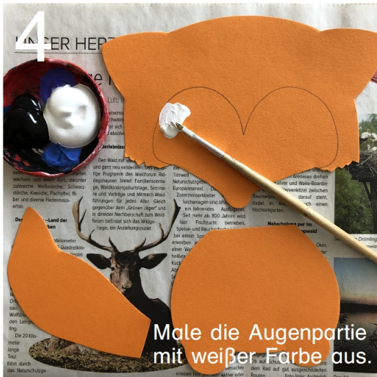
4 Male die Augenpartie mit weißer Farbe aus.