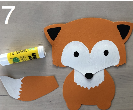
7 Klebe die einzelnen Teile zusammen.