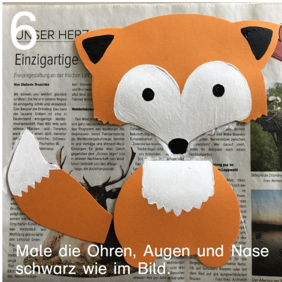
6 Male die Ohren, Augen und Nase schwarz wie im Bild.