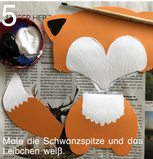
5 Male die Schwanzspitze und das Weibchen weiß.